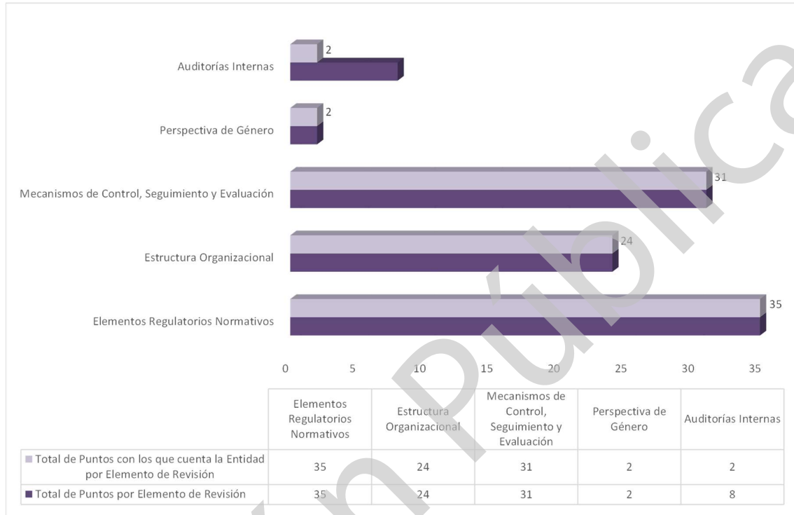
Grafica 1 Cumplimiento de los Mecanismos de Control Interno Ejercicio 2020

FUENTE: Elaboración de la Auditoría Especial de Evaluación de Desempeño, con base en la información reportada por el Ayuntamiento de Mazapiltepec de Juárez, en el cuestionario de Control Interno de la Auditoría Superior del Estado de Puebla.